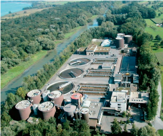
«End-of-Pipe» ist nicht das Ende: Es gibt Alternativen zum Gewässerschutz durch Kläranlagen