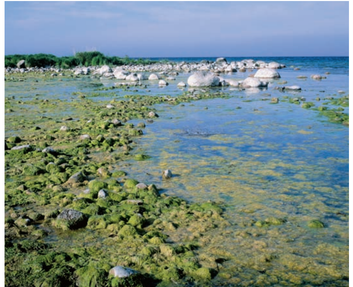
Nicht alles ist gut, was grün ist: Die NoMix-Technologie könnte schnell zur Lösung der Überdüngung von Küstengewässern beitragen