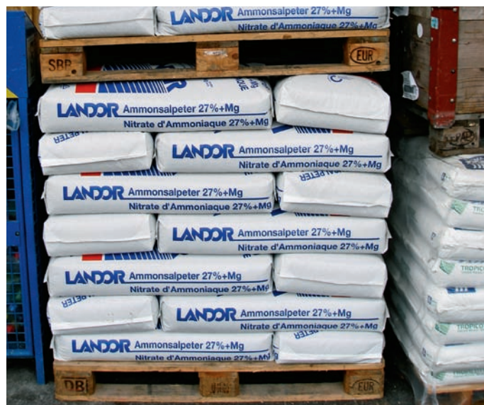
Das Problem im Griff – und im Sack: Nährstoffe aus dem Urin sind in Gewässern unerwünscht, aber als Pflanzendünger nützlich

Pilotprojekte durchführen – grössere Demonstrationsprojekte aber bereits nicht mehr (Nova PP). Die weitere Entwicklung hängt also massgeblich von den Einwänden der Sanitärindustrie ab.